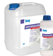
KNAUF UNIVERSALGRUND Środek gruntujący