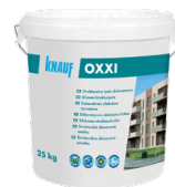
KNAUF TYNK DEKORACYJNY