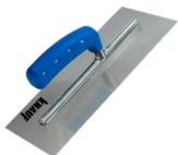
KNAUF PACA NIERDZEWNA DO SZPACHLI