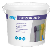
KNAUF PUTZGRUND Podkład pod tynki