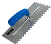
KNAUF GRZEBIEŃ DO GLAZURY 10 MM Profesjonalna paca zębata

OXXI S BARANEK / ADDI / KATI / CONNI / RP 240 / SP 260