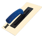
KNAUF PACA DO TYNKÓW DEKORACYJNYCH Profesjonalna paca do zacierania